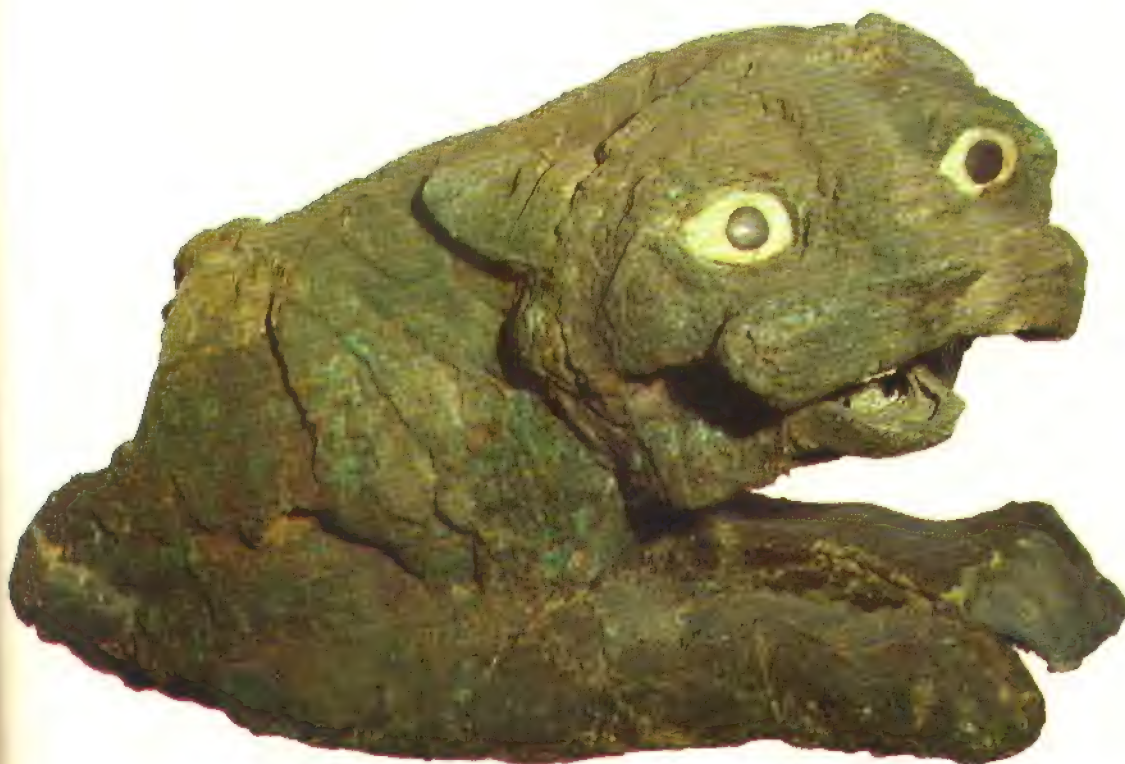
Cabeza de león de cobre fundido hallada en las excavaciones de Mari, correspondiente al III milenio a. de J. C. (Museo del Louvre, París). Seguramente esta cabeza era la de uno de los leones guardianes del templo de Dagán.

bletas con inscripciones cuneiformes, los primeros reyes de Caldea reinaron cada uno varios millares de años. Es de admirar la precisión de los sacerdotes babilónicos que trazaron estos cómputos fabulosos; según uno de ellos, veintitrés reyes de la ciudad de Kisch reinaron ni más ni menos que 24.510 años, tres meses y tres días y medio.